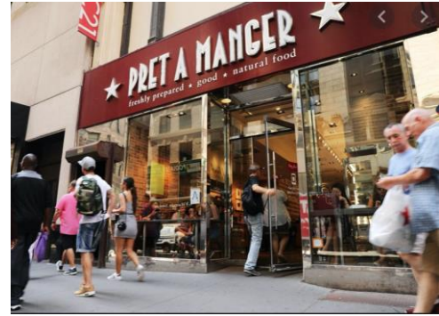
Pret A Manager UK. 400+ stores